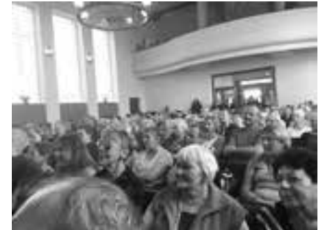
Při koncertu Spirituál kvintetu

Najednou tu bylo odpoledne a do opět zcela zaplněného Sboru Páně nastoupila muzikantská